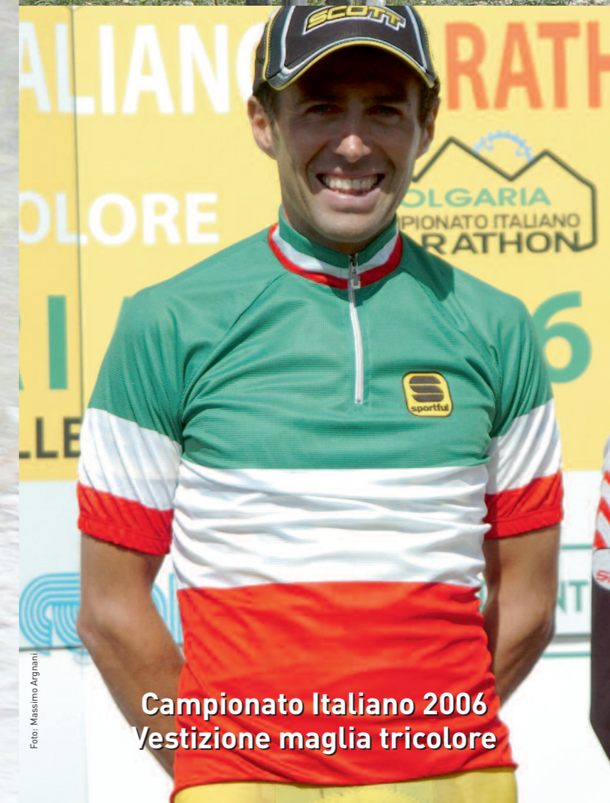
Campionato Italiano 2006 L'arrivo vittorioso di Gibo